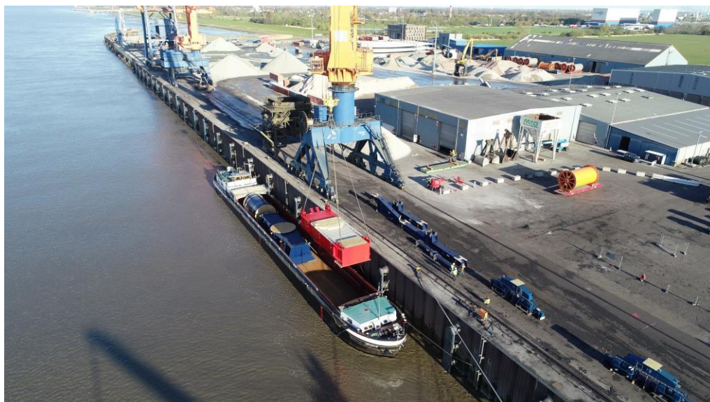
Entladung eines Binnenschiffes im Brunsbütteler Elbehafen