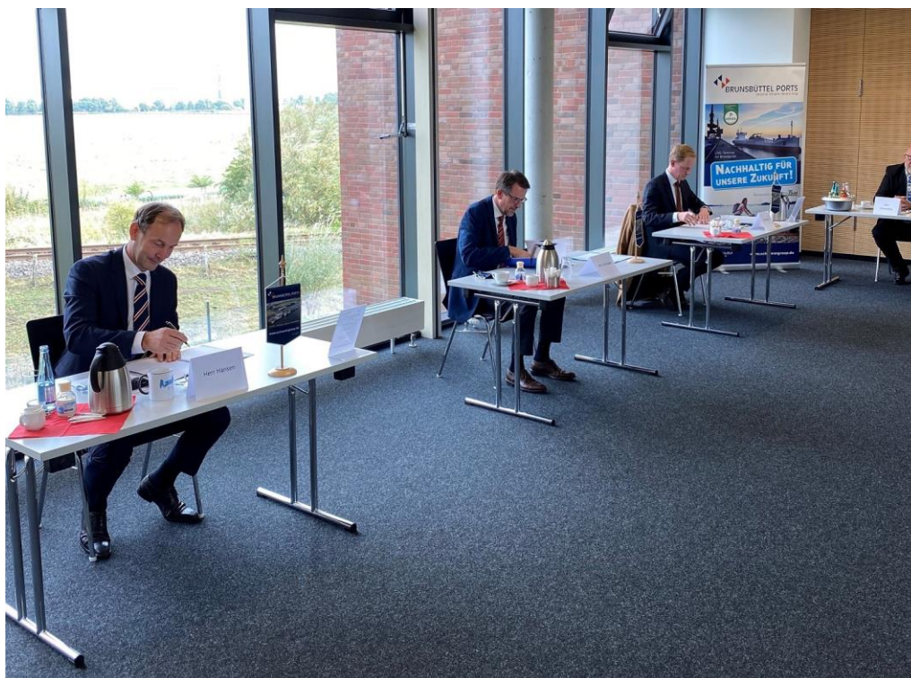
Unterzeichnung der Kooperationsvereinbarung