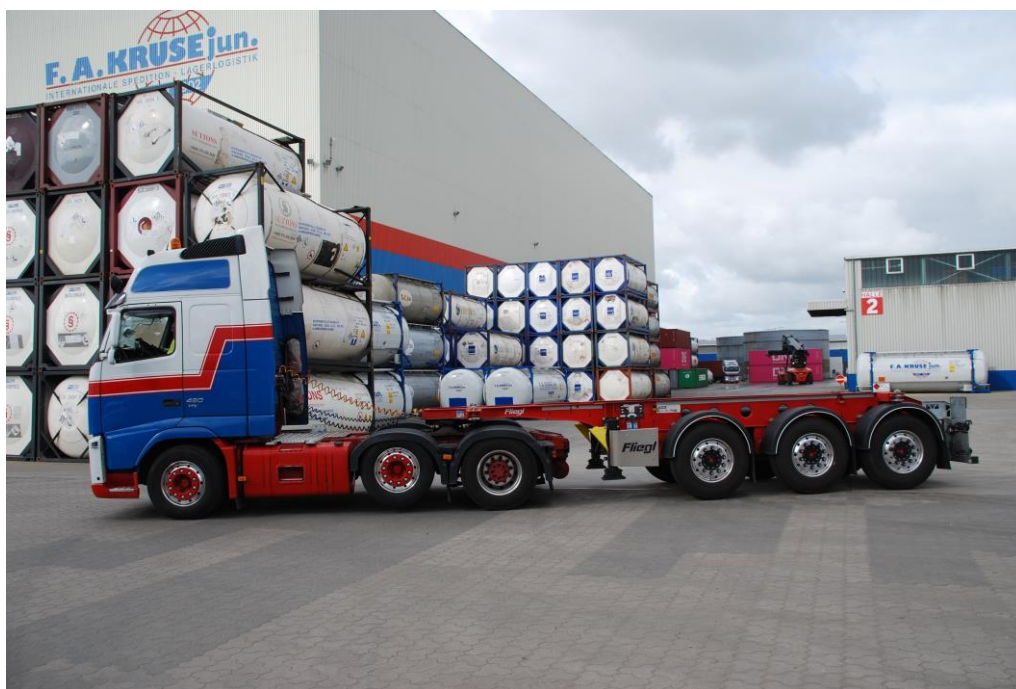
Ein LKW der Friedrich A. Kruse jun. Unternehmensgruppe